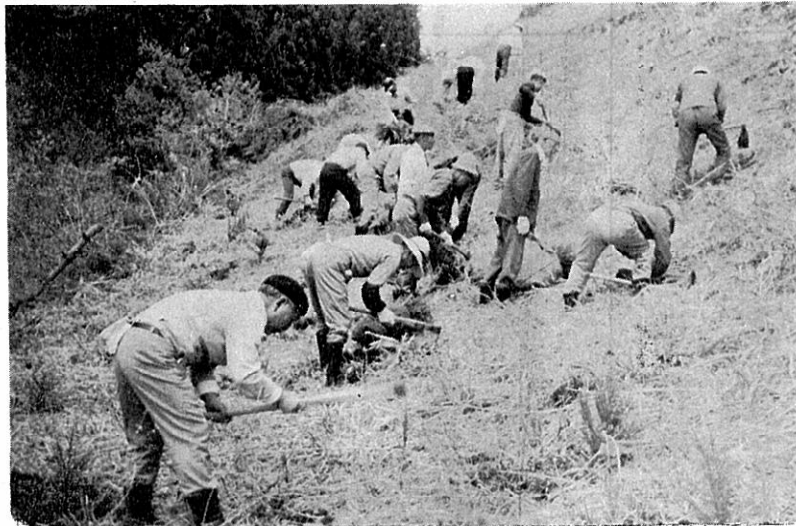
「健康と豊かな暮らしを生む緑」