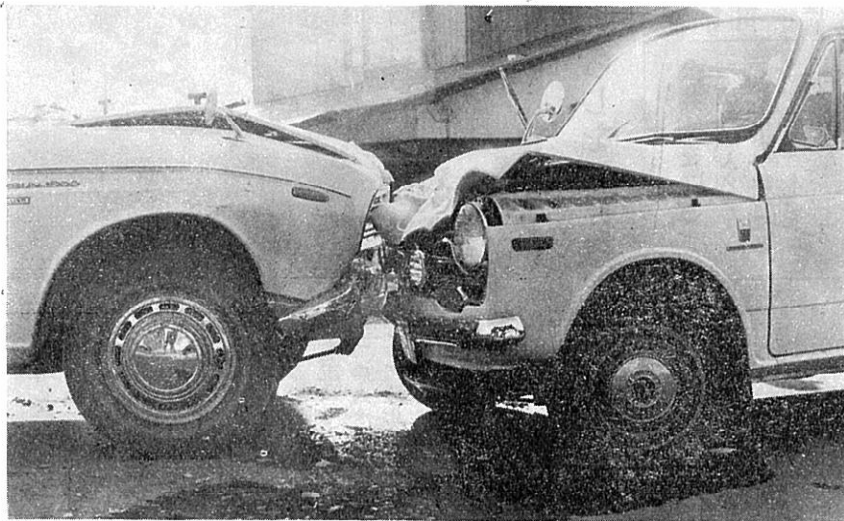
(無謀運転はやめましょう)

この運動は酒飲み運転、無免許運転及びスピードの出し過ぎ等による悲惨な交通事故を未然に防止する目的で実施されている。 ◎ スローガン 酒飲み運転をみんなで追放しましょう ◎ 運転の重点 運転者に対しては、酒を飲んだら絶対運転しないよう、させないよう、町民みんなで協力しましょう。