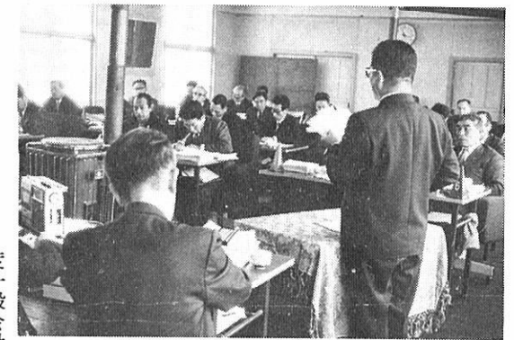
四十九年度予算案の審議中

米内沢地内の交通規制が強化 一、四月中旬から新丁かねき書店前から、本丁、横町、新町郵便局前までの駐車禁止が、終日規制になります。