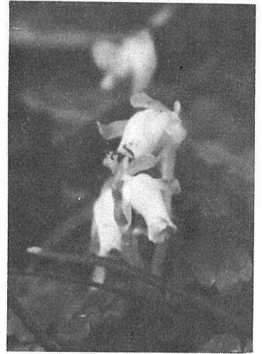
高山植物 ギンリョウソウ