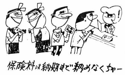
保険料は納期まで納めなくちゃー