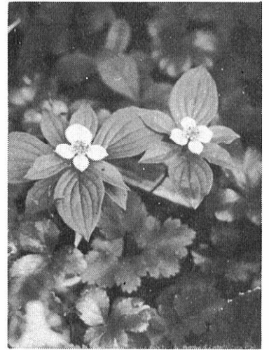
(高山植物) ゴゼンタチバナ

奥さんのパート収入も、その収入によっては税金がかかったり、ご主人の税金にも影響したりするのでご注意ください。 パート収入は、年間七十万円まででしたら、配偶者控除が受けられるし、税金もかかりません。しかし、七十万円を超え、七十九万円以下の収入がありますと税金はかかりませんが、配偶者控除は受けられません。 さらに、七十九万円を超えますと、配偶者控除が受けられないだけでなくパート収入に税金がかかります。