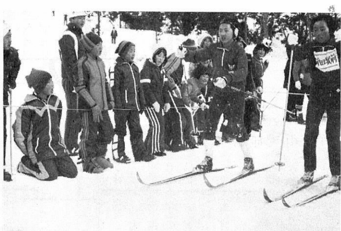
小学生部落対抗リレー 本郷上チームのラストスパートが見事でした