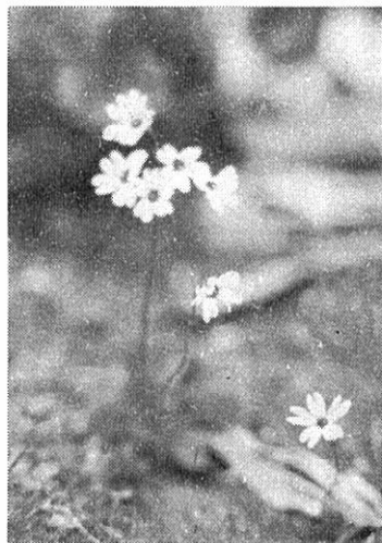
高山植物 ヒナザクラ