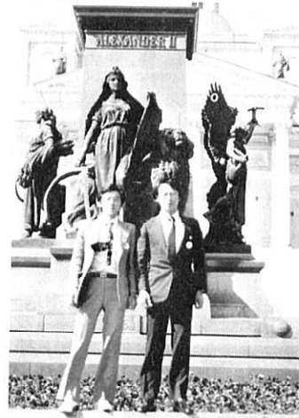
フィンランド、ヘルシンキ市内の公園にて。芸術的な彫刻と白亜の教会が北欧の気品を感じさせる。

その過去は、侵略と略奪の日々で綴られている。かつてナポレオンがこの地を攻め、ヒトラーが攻め、そして古くはゲルマン民族の大移動が歴史に登場する。一世紀に北上したフィンランドが建て、その後ロシアやスウェーデンから幾度となく侵略され続け、占領の歴史だけが深く刻み込まれた緑の王国フィンランド。十八世紀のヨーロッパでは、ただの貧しい農業国にしか過ぎなかったこの国が、今では