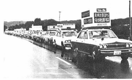
非行防止をうったえ車でパレード

「青少年を非行から守る全国強調月間」の実施にあたって、森吉地区、阿仁地区の少年保護育成委員会と森吉警察署は、阿仁部四ヶ町村をリレーパレードし、非行防止をうたったえましました。親の願いとは裏腹に、年々少年非行が増え、低年齢化の傾向をたどる一方で、内容的にも、凶悪、粗暴事犯が増加するなど新たな問題をばらんでいます。夏休みは、子供たちの生活のリズムが乱れ、気持ちもゆるみがちで、親の目も届きにくくなります。楽し