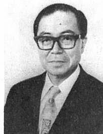
秋田県知事 佐々木喜久治

県民の皆様、日頃県政の推進にあたっては、格別のご協力を賜わり、厚くお礼申し上げます。 さて、水田利用再編対策については、一昨年来農家は目標面積を更に増大