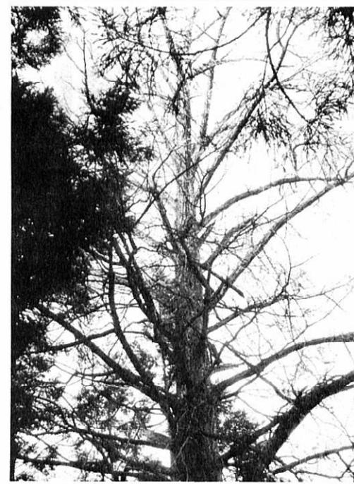
大岱神社の公孫樹

ある古老は、終戦前後の食糧難時代、村々がバケツで実を分け合ったことが懐しく思い出される。と語っていた。