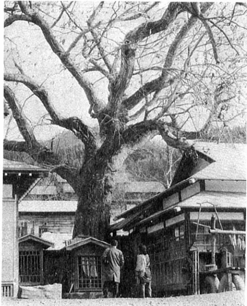
止の皂莢(サイカチ)