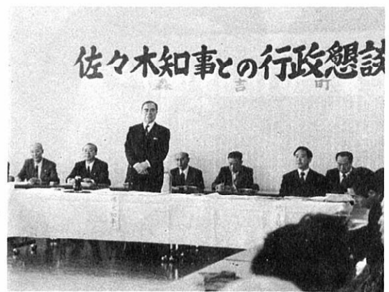
秋田市の短絡路線として秋田峠トンネルを中心としたが、これからは上小阿仁川米内沢105号線の改良、パイパスなどというがどう考えているかおしえていただきたい。また協賛体制に入って

(1)阿仁川ダム問題 わが町開びやく以来の問題と受けとめ、こうした時代なので将来の生活に不安動揺をもっている。建設費、県におきましてもその対応に十分な吟味をお願いしたい。 質、量からしても役場だけでは荷が重すぎるので県の事務所を設置してほしい。また雇用の場として工場の誘致に力添えをお願いしたい。残存地に対する対応に特段の認識をお願いしたい。