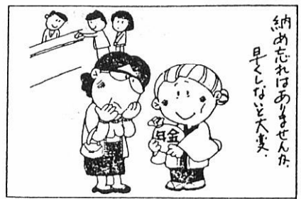
納め忘れありませんか。早くほど大差。

結論から述べますと、あなたの場合は六十五歳を過ぎて追納できます。追納は、老齢年金や通算老齢年金の受給権者になる前であればできます。受給権者となるのは、六十五歳となったとき、あるいは六十五歳前に繰り上げ受給の手続きをしたときですが、あなたの場合は繰り下げ受給の申し出をしていますが、六十五歳になっても受給権者となりません。したがって追納できます。あなたが受給権者となるのは、