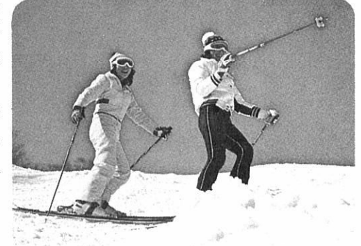
森吉山春山 スキー登山

主 催 森吉町 日 程 4月26日(日) 時 間 8時30分 登 場 森吉町 集合 森吉町 出発 森吉町 目的地 「こめつが山荘」 「こめつが山荘」 「こめつが山荘」 下山、森吉町に到着 次第解散 費用 一人500円 用意するもの 防寒具、着替え、昼食、飲物、嗜好品、スキー等 参加申込み 4月25日まで 森吉町役場商工観光課 ☎0186(72)3111 雨天の場合は中止