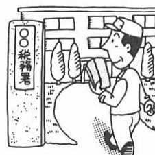
所得税の確定申告 (2月16日～3月15日)