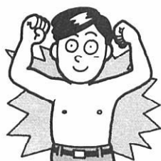
成人病予防週間 (2月1～7日)