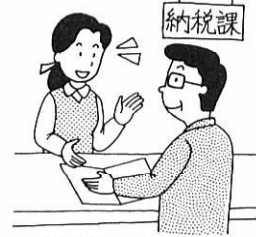
消費税の確定申告 (個人事業者 1月1日~4月1日)