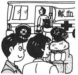
はたちの献血キャンペーン (1月6日~2月5日)