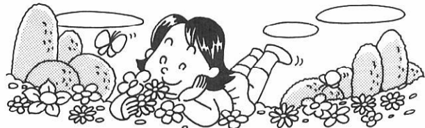
森の中 緑がゆれる 笑ってる

【国際交流員コラム】 森吉町を去る前に (3月27日帰国) 芽吹きの季節がやって来ました。そろそろ帰国するのか、と思うと懐かしい思い出に胸がいっぱいになります。 一年は本当に「あっ」という間に、夢みたいでした。焼き魚のアユ、ぱりぱりとした大根漬、熱いきりたんぽの味は、なかなか頭から消えません。最も忘れられないのは、皆さんのご親切と温かい心遣いです。着いた翌朝の雪景色と熱いお弁当、春の「小京都」角館の花見、夏の桃洞の滝と男鹿半島の青く澄んだ海の色、秋田の竿燈祭り、秋の玉川温泉と八幡平の紅葉、田沢湖の夕暮れ、冬の浅虫温泉と森吉山での初めてのスキー体験・家庭のような温もりを感じ、外国人という言葉がすっかり忘れてしまい、皆の中に溶け込んで仕事の楽しみを味わいました。 週に一回前田小の正課クラブ「中国語会話」の授業に行くのはとても楽しいことでした。授業の後、子供たちに囲まれて、あれこれ聞かれたり、聞かせたり、中国に関心と興味を示し、「弟の名前はこれ、中国語では