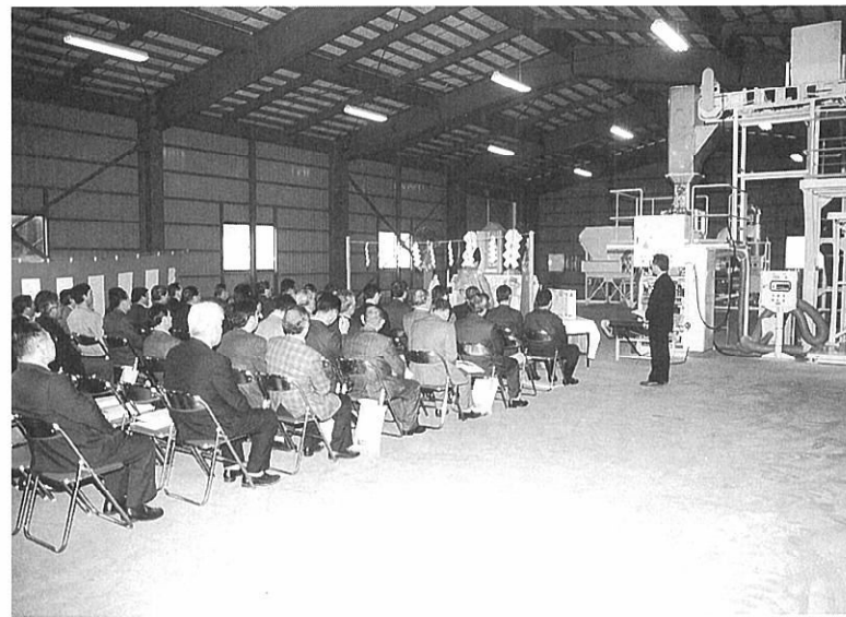
森吉町有機センター竣工式(3月31日)