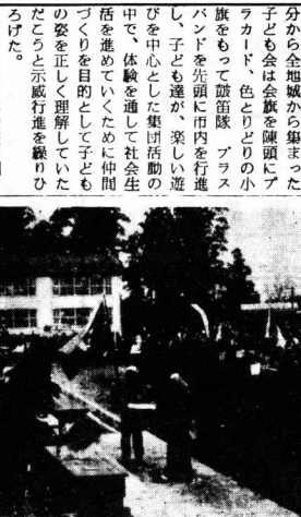
[町長から表彰を受ける、よい子ども会代表]

大会に先だつて九時二十分から各地域から集まった子ども会が会旗を振りながら、色とりどりの小旗をもつて遊園地、プラッパンを先頭に市内を行進し、子ども達が、楽しい遊びを中心とした集団活動の中で、体験を通して社会生活を進めようとする仲間づくりを目的として、この姿を正しく理解していただこうと示行進を繰り返した。