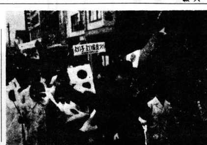
[会旗を陳頭に小旗をもつて行進する単位子ども会]

選出が行なわれました。町には現在一〇八子ども会、四四五〇名の児童が参加し、校外生活活動を自主的に進めておられます。子ども会ごとに育成会があり子ども会ごとに育成会があり世話人がいて、会相互の連絡をはかり、子どもの幸せを大いに伸ばそうという