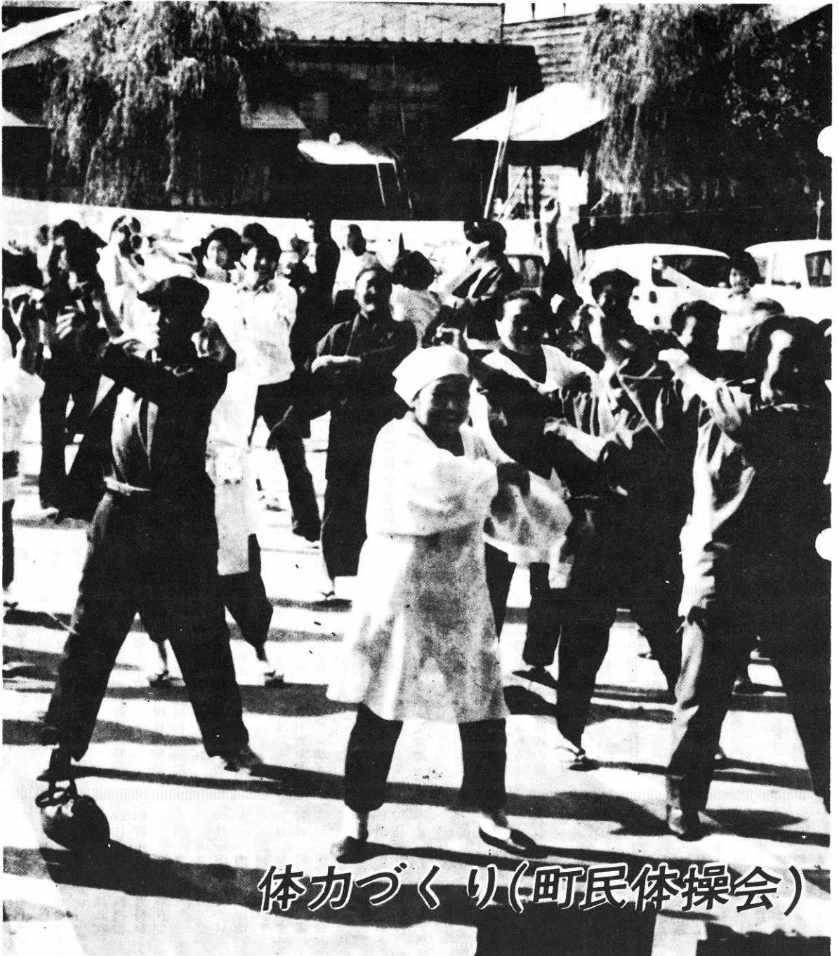
体カづくり(町民体操会)