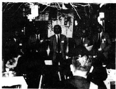
オーストラリアからの研究生