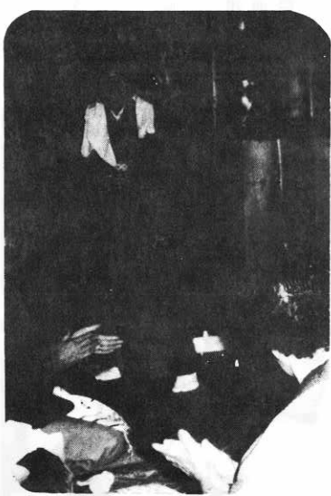
▲一杯はいると踊りもでました(今泉で)