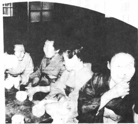
生きじてよかったね。(緑ヶ丘で)