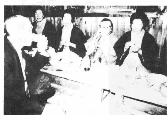
▲お酒はコップ一杯を適量にしているんでね(今泉で)