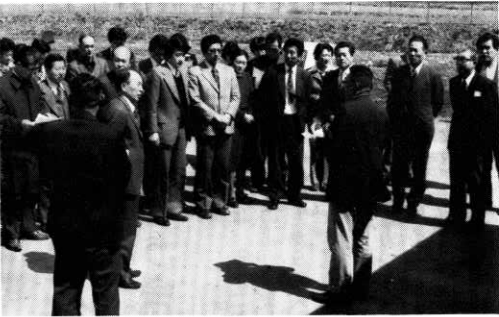
施設を見学する転任教員