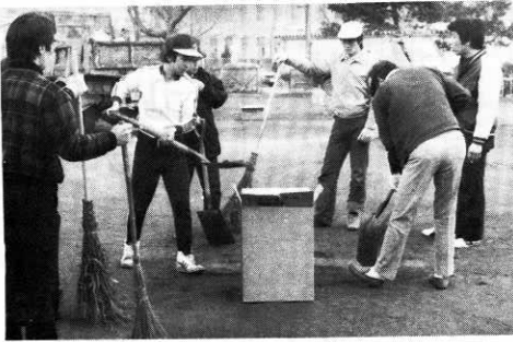
児童公園を清掃する町商工青年部員

また同青年部では、児童公園のよごれをいつでも掃除ができるように、公衆便所横にホウキ立てスタンドと竹ボウキ五本、それに