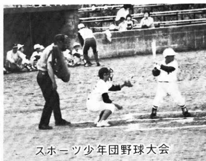
スポーツ少年団野球大会