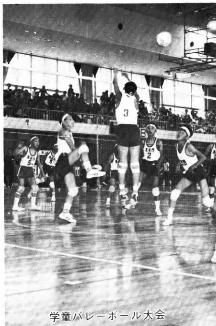
学童バレーボール大会