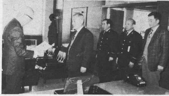
▶全国表彰の伝達式

〈訂正〉 昭和52年度分税の申告始まるの記事中、申告しなければならぬ人のうち、「52年中に所得のあった人」とあるのは、「51年中に所得のあった人」ですのでおわびして訂正いたします。