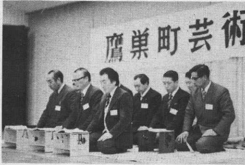
▶練習の成果を披露する謡曲会員