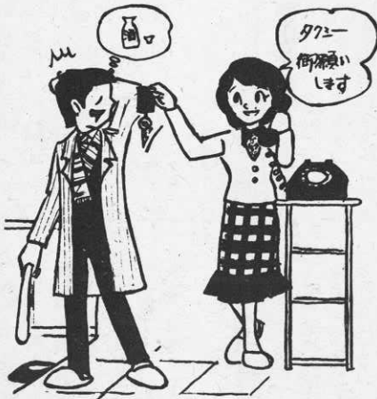
お酒を飲むときはタクシー等で……

町民のすべてが、「飲んだら運転しない」「運転するときは飲まない、飲ませない」「飲んだ人には運転させない」の鉄則を励行してください。