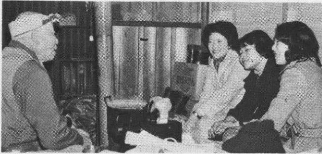
▶老人を慰問するボランティア会員

一人暮らしの老人がどんなに話相手を求めているか、痛いほど感じたそうです。真心をもって接すれば必ず通じあうものがある…とその日は実に活気に満ちた反省会