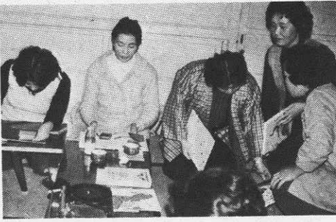
▶ 童話の勉強する糠沢の若妻

子どもに読書を望むなら、まず母親自身から―と、図書館の童話を借り受けて「新しい勉強が始まった」と、目を輝かしている若妻の集団があります―糠沢学級です。