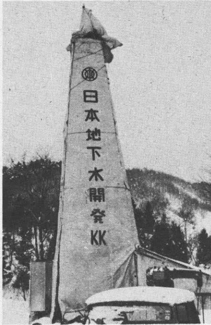
▶温泉開発ボーリングのやぐら

小森字湯の岱地内で、待望の「温泉ボーリング工事」が、二月五日から開始されました。 温泉の掘さくの現場には高さ約十三メートルのやぐらが組まれ、地下四百メートルをめざして本格的なボーリングに入りましたが、温泉湧出を大きく期待する地域の人たちや関係者の目は、工事の進行に集中しています。