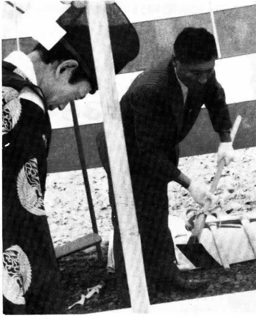
くわ入れをする出川町長