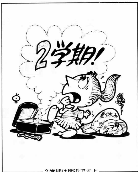
2学期は間近ですよ

鷹巣高等職業訓練校では、昭和五十五年訓練生を次の要領で募集しています。 募集科目は、▽高卒コースⅡ建