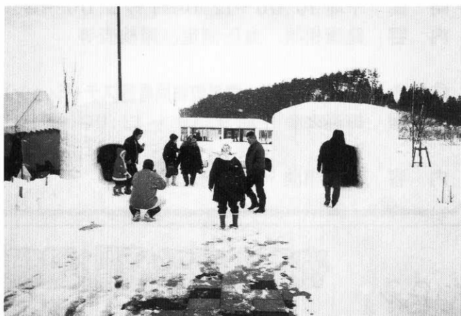
大きなかまくらをバックに記念写真