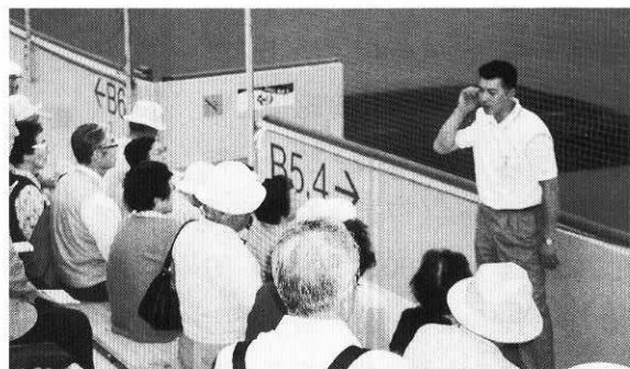
全体講座(施設見学)