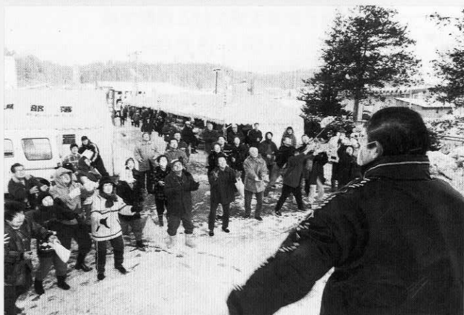
紅白の餅まき両手を広げうまくキャッチ？

市ではいろいろな餅が販売され、観光客は試食しながら、手づくりでおふくろの味がするとあって、たくさん買っていました。