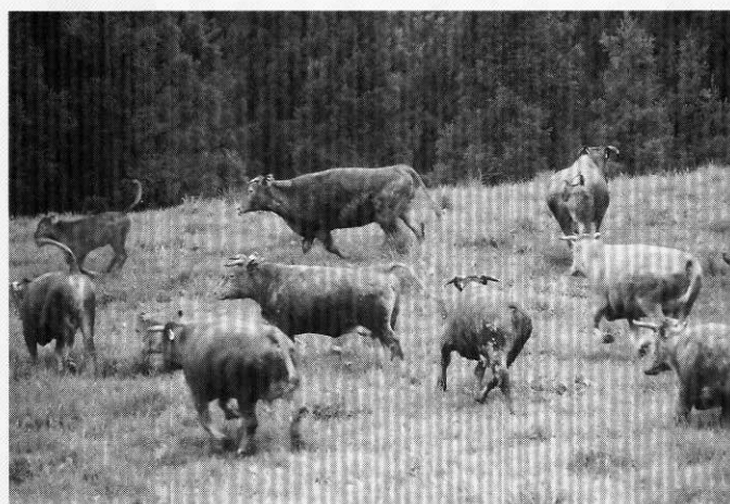
放された牛たちが元気に走り回る

この日はあいにくの雨でしたが、20人の組合員の60頭の和牛が衛生検査でチェックされた後、牛たちの手綱はずされ、囲いのトビラが開けられると我先にと勢いよく飛び出し、牧場内を、元気に走り回っていました。