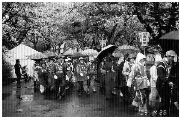
桜のふれあい広場前を雨にも負けず元気にスタート