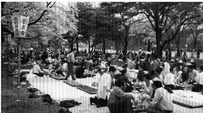
29日の「桜を観る会」に参加した各団体・グループ

第52回中央公園桜まつりが4月25日から5月5日までの11日間開催され、期間中は天候にも恵まれ、桜の開花時期も合って町内外から大勢の花見客でにぎわいました。中央公園は、新秋田30景にも選定されている景勝地で、園内には約700本のソメイヨシノが植栽されています。初日の25日、桜は五分咲きで曇り空でしたが、正午からふれあい広場で鷹巣町観光協会や関係者によるテープカットなどオープニングセレモニーが行われ、町内のデイスーパー利用者や町内外の団体などがシートを広げ、ゴザを敷き車座になって楽しんでいました。