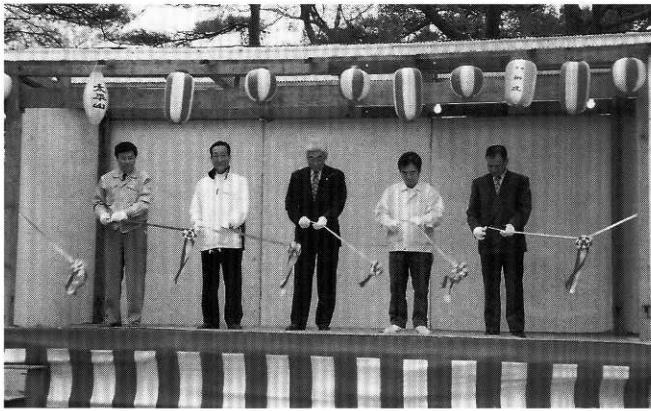
25日オープニングセレモニーでのテープカット

第52回中央公園桜まつりが4月25日から5月5日までの11日間開催され、期間中は天候にも恵まれ、桜の開花時期も合って町内外から大勢の花見客でにぎわいました。中央公園は、新秋田30景にも選定されている景勝地で、園内には約700本のソメイヨシノが植栽されています。初日の25日、桜は五分咲きで曇り空でしたが、正午からふれあい広場で鷹巣町観光協会や関係者によるテープカットなどオープニングセレモニーが行われ、町内のデイスーパー利用者や町内外の団体などがシートを広げ、ゴザを敷き車座になって楽しんでいました。