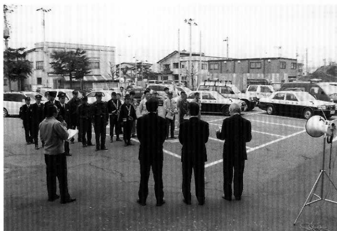
キャラバン隊出発式を行い山火事予防を訴える

山火事予防運動は、山火事が多発する時期を迎え、予防思想の普及を図り、森林資源と自然環境の保全を目的に、4月1日から5月31日まで「温暖化 防ぐ森林 守ろう火から」を統一標語として、展開されています。