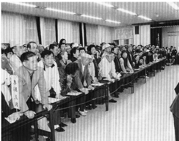
開票を注意深く見守る大勢のみなさん