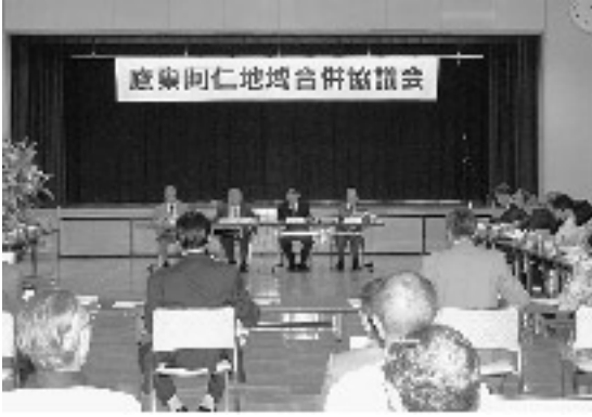
議員の定数及び任期などが協議された第7回法定協議会

7月1日、第7回鷹巣阿仁地域合併協議会が阿仁町ふるさとセンターで開催され、継続協議となっていた協議会の議員の定数及び任期の取扱いについては、現在の4町の議員74人（鷹巣町24人、合川町18人、森吉町18人、阿仁町14人）が期間を1年間とする在任特例制度を適用することに決定しました。 はじめに4町の議長から各議会で集約した意見を報告。各議会とも在任特例を主張し期間は6カ月から1年間。これに対し第3号委員（学識経験者）からは「合併の目的は行財政のスリム化、在任特例はこれに反する」「昨年の住民アンケートで、約38%が合併により議員の減少によるコスト削減を望んでいる」など、在任特例に反対の声が出されました。その後、事務局から、定数特例26