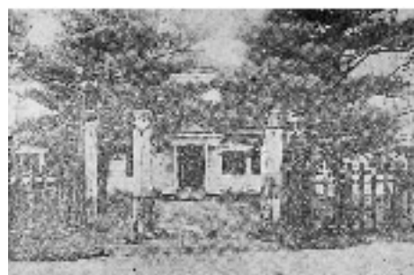
大正15年に廃止になった郡役所（現在の鷹巣郵便局の隣接地のあたり）。その後昭和17年、ほぼ同じ場所に県の地方事務所が設置された。

（中略）然し、本町にとつて待つに待ちきれない焦燥の一事がある。それは云わずもがな、阿仁鉄道の速成である。本町より分岐となれば阿仁方面の木材、石炭等、すべて物資は本町に集まり鷹巣駅頭に見るも素晴らしき貨物の堆積が見現するに違いない。