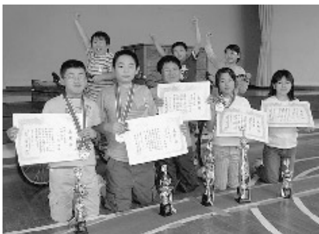
優勝した竜森小のメンバー