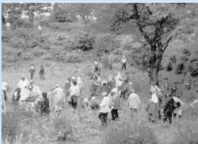
関係者合わせて170名が植樹に汗を流しました

婦団連では、今後も可能な限り植栽を続け、中央公園を四季を通じ花の絶えない公園にしたいと考えているそうです。