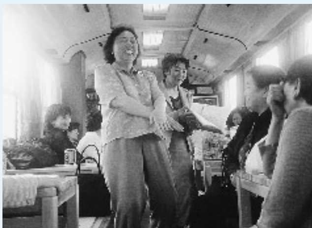
自由な雰囲気の貸切列車。みなさんもいかが？

また、小ヶ田駅の表示板が乗客からは見にくいことなど、乗ってはじめて気が付いたことも多く、収穫の多い旅となったようでした。