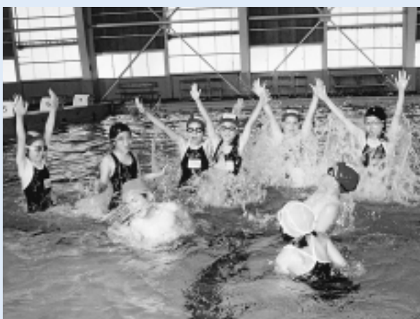
子どもたちも学校帰りに利用しています

利用時間は次のとおりです。第1回(10時～12時)第2回(13時～15時)第3回(16時～18時)※第4回(19時～21時)※は高校生以下は利用できません。