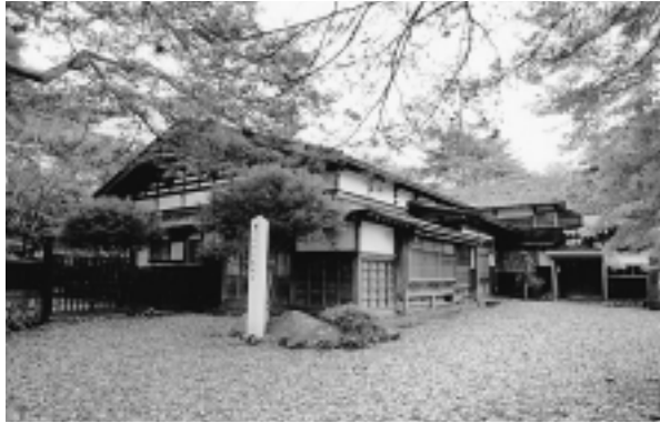
文政年間に建築されたといわれる長岐邸は、藩政時代そのままに悠々の時を刻んでいる。多数の書籍、文書などは「長岐文書」として県立図書館に保存され、当時の政治、文化を知るうえで貴重な存在となっている

6月23日、七日市公民館にて自治会長など地域の方々17名が参加し「長岐邸」保存活用の七日市地区懇談会が行われました。