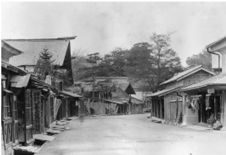
大正時代の仲町（現在の中央保育園の通り）

米作を除いては著しき生産をなすものではなく製材は五万八千円、清酒は五万一千円、木綿二