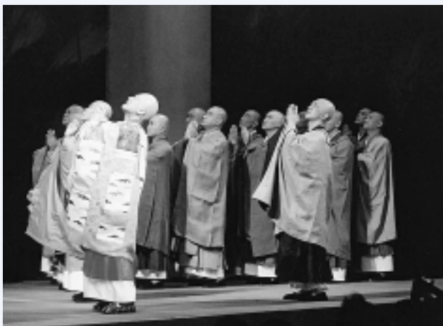
鷹巣町からも3名の住職の皆さんが出演

舞台の終盤では、地元の住職の皆さん10名が、渡日する中国僧役として出演し、俳優とともに経文を唱えるなど、地を行く演技に惜しめない拍手が送られていました。