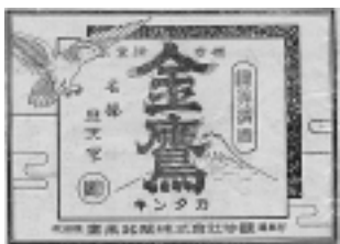
酒の醸造も小さな産業だった（鷹巣の銘酒「金鷹」のラベル）