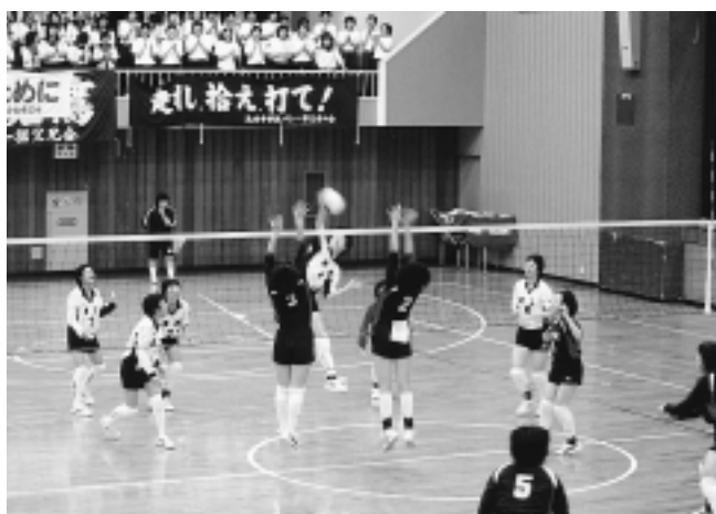
予選から実力を発揮した鷹中(対大館東戦)