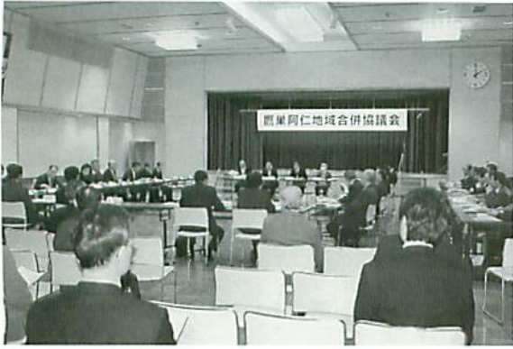
第2回鷹巣阿仁地域合併協議会

3月2日、阿仁町ふるさと文化センターで、第2回鷹巣阿仁地域合併協議会が開かれ、協定基本4項目（合併の方式、合併の期日、新市の名称、新市の事務所の位置）などが協議されました。