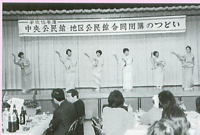
1年間の学習の成果を発表した閉講のつどい

引き続き開催された交流会では、定期講座の演習発表を行ない、新舞踊や民謡踊りなどで会場を賑わし、最後は「早春賦」を全員で合唱しこの一年を閉じました。