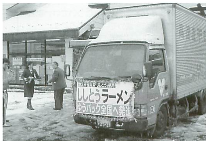
県内外へ配送されるししとうラーメン