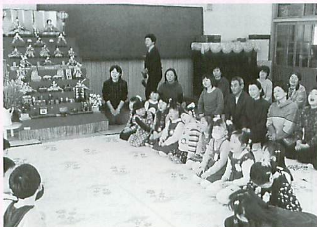
祖父母と一緒にいられた雛祭り茶会

この日西幼稚園では祖父母参観日であったことから祖父母もお茶会に招待し、年長組の女の子がお菓子やお茶を運びました。また、北幼稚園では、緊張した面もちで教えられた作法どおり上手にお茶を飲みました。