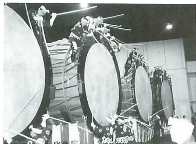
綴子下町・上町大太鼓保存会による叩き初め