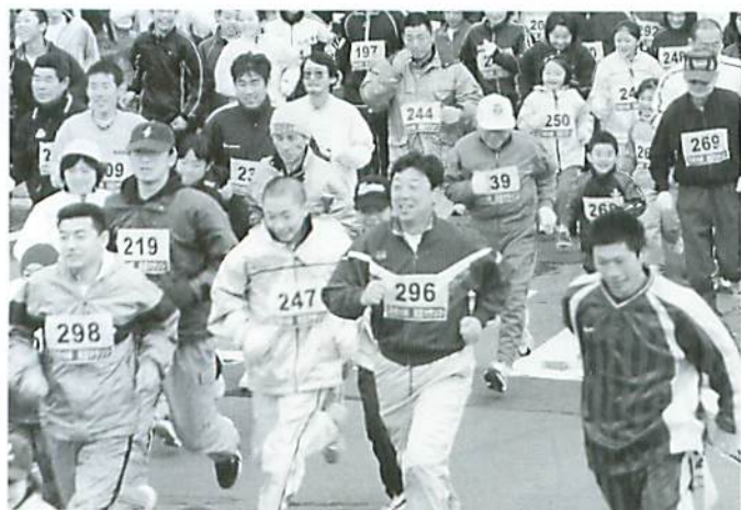
笑顔でスタートする2004年

大会は、2キロのファミリーコースと、4キロのチャレンジコースで行われ、2歳から70歳代まで幅広く、また帰省中の家族も親子で参加していました。岸部町長の合図で一斉にスタートし、快調に走り出す人、お母さんと手をつなぎ一生懸命走る幼い子や、途中でお父さんに抱えられゴールする子など様々でした。