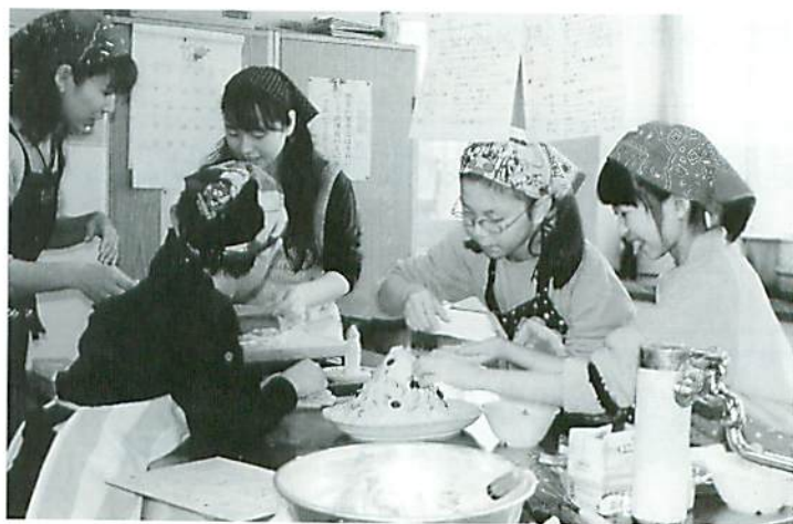
とても楽しく上手に作りました