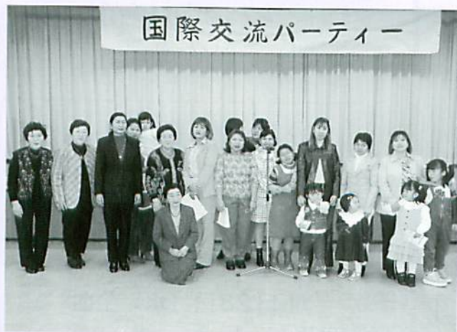
フィリピン出身の皆さんと婦人の会

当日は、踊りや手品などたくさんの催しがあり、中でもフィリピン出身の皆さんによる、母国のクリスマスソング合唱は開場の雰囲気をおもたせました。