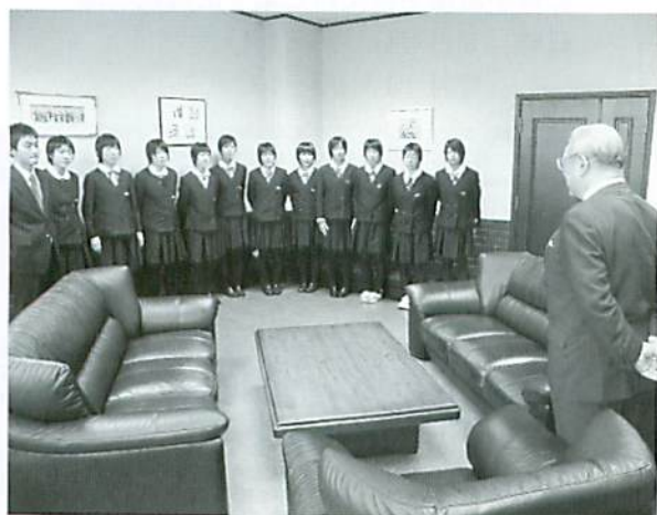
鷹巣高校女子チームの皆さん

同チームは21日午前10時20分の号砲とともにスタートし、5区間21・0975 + を一本のタスキに母校の名譽、3年間の思い、そして家族・友人など様々な方の夢を馳せ、師走の京都・都大路を疾走しました。結果は、1時間15分48秒、県予選・昨年の全国大会タイムを上回りましたが、目標の記録には及ばず54位となりました。チームの皆さん、大変お疲れ様でした。4年連続を目指し頑張ってください。