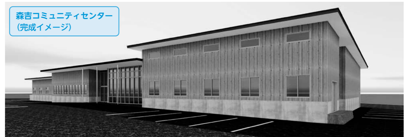
森吉コミュニティセンター (完成イメージ)

現在の森吉コミュニティセンターは、建築基準法上の鉄筋コンクリート造2階建、延床面積1,968㎡、昭和56年7月に建築され44年が経過しています。地域の皆さまから施設の老朽化、バリアフリー化、トイレの洋式化、駐車場の不便さなどの解消を求める要望のほか、階段が多く避難所に適していないなどのご意見が寄せられていました。市は令和7年度から改築事業を進めており、この度、基本設計が完成しましたのでお知らせいたします。基本設計には、現状の課題解決のため、検討委員の皆さまが持ち寄った情報と地域の皆さまの要望が集約されております。