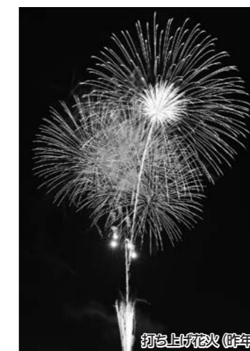
打ち上げ花火(昨年)