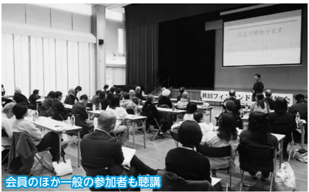
会員のほか一般の参加者も聴講

●読み聞かせ会(図書館・公民館図書室) ◆5/9(土) 14時 森吉:おはなしばれっと ◆5/16(土) 14時 鷹巣:おはなしでてこい ◆5/23(土) 14時 合川:おはなし会 ちょこっと ※「鷹巣:おはなしでてこいみに」はお休みです。