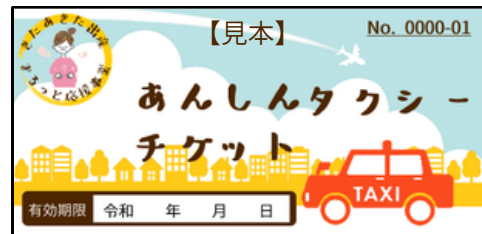
【タクシーチケット見本】

このタクシーチケットは、 妊産婦本人の妊婦健診、出 産、産後健康診査等による 通院時のみご利用出来ます。