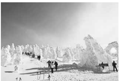
▲森吉山「樹氷」（阿仁スキー場）