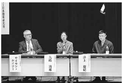
▲「ストーンハンジと縄文シンプोजウム」パネルディスカッション