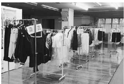
▲学生服等リユース無料譲渡会（合川庁舎）