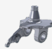
▲フロントスピンドル