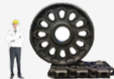
▲ドライバンプラ・シュー