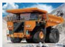
▲超大型ダンプトラック

杓、落下防止金具類、ケーブルバンド、大径間建物柱、接合部材、柱脚ベース、ドーム構造の接合部材等建設、機械以外の製品も製造しております