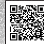
◀伊勢堂岱遺跡特設ページ XRデジタル×縄文体験