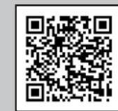
▲Digi田甲子園2023 特設ページ

デジでん 「Digi田甲子園」とは… 地方公共団体、民間企業・団体など様々な主体がデジタルの力を活用して地域課題の解決等に取り組み事例を幅広く募集し、特に優れたものを内閣総理大臣賞として表彰する取り組みです。