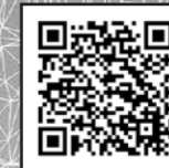
◀Digi田甲子園2023 北秋田市紹介ページ

このシステムは、伊勢堂岱縄文館内に設置したタッチパネルモニターとホームページから閲覧でき、オンライン世界と現実世界を融合させ、新たな体験を創り出す総称であるXRを実現しており、この取り組みはイギリスで開催された国際会議でも高い評価を得ています。