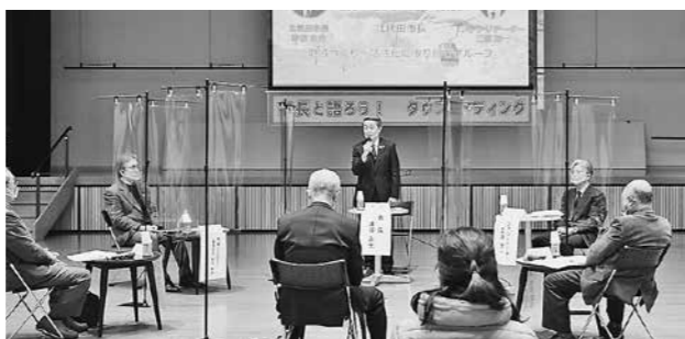
▲2021年のタウンミーティングの様子