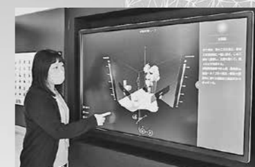
2D鑑賞システム【みどころキューブ®】