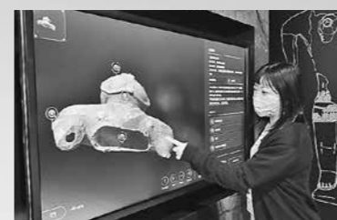
3D鑑賞システム【みどころビューア®】