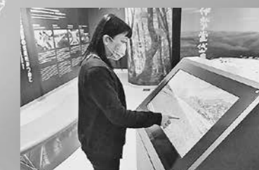
360° VR鑑賞システム【バーチャル散策】