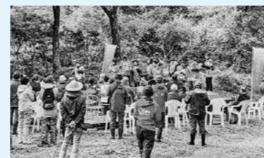
▲フォルクローレコンサートの様子

今年も米代児童公園がメイン会場となる「きらきらフェスティバル」では、商品券が景品になっているフォトコンテストが開催中です。ので「#北秋田きらフェス」のタグで写真を投稿してみたいか、うかがいましょう！