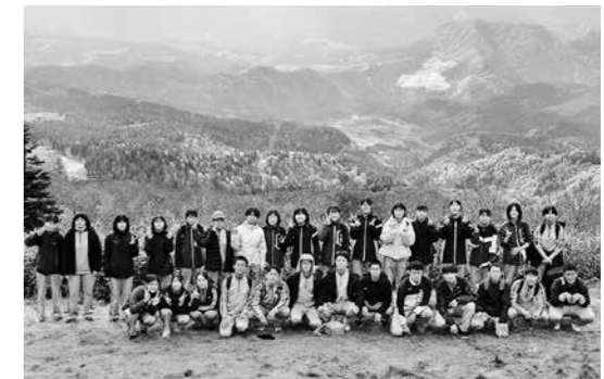
▲10月23日 合川中「全校野外活動」～森吉山～