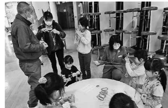
▲10月20日 鷹巣東小「地域ふれあい交流会」～同校～