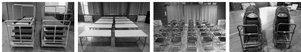
▲折りたたみテーブル台車2台 ▲折りたたみワークテーブル10台 ▲折りたたみ椅子30脚 ▲折りたたみ椅子台車2台