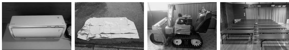
▲エアコン1台 ▲エアコン室外機用カバー1枚 ▲除雪機1台 ▲折りたたみテーブル15台