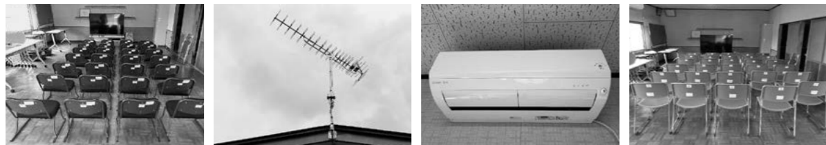
▲座椅子28脚 ▲アンテナ3基 ▲エアコン1台 ▲スタッキングチェア30脚