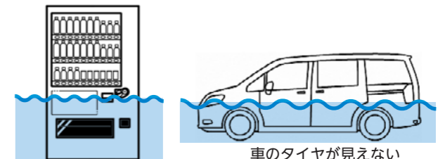
自動販売機の取り出し口が浸水している