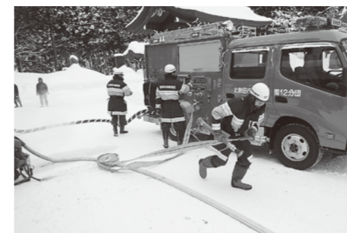
☎ お近くの分団員、消防本部総務課 62-1119

(管轄区域:大阿仁 団員数:38人(4/1現在)) 私たち第12分団は、和気あいあいとした雰囲気、団員同士が様々な活動を通じて絆を深めています。しかし、近年は団員数の減少と高齢化が進み、団員の平均年齢も年々上がっている状況です。地域の皆さまの団活動に関するご理解とご協力に感謝します。