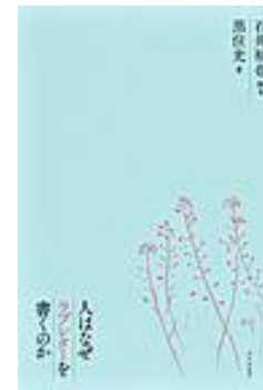
人はなぜラブレターを書くのか 石井 裕也 / 脚本 黒住 光 / 著 リトルモア

2000年3月8日に発生した、地下鉄脱線事故。悲劇から20年もの月日が経ち、寺田ナズナは、とある青年に手紙を書きはじめる。24年前、17歳のナズナは、いつも同じ電車で見かける高校生・信介にひそかな想いを抱いていた。一方、信介は学校帰りにボクシングに夢中な生活を送り、プロボクサーを目指していた。人の想いは、いつまでも色あせることなく繋がっていく。