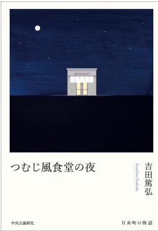
つむじ風食堂の夜 吉田 篤弘 著 中央公論新社