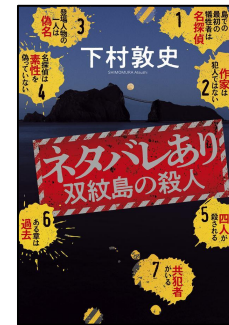
ネタバレあり 双紋島の殺人 下村 敦史 / 著 光文社

「島での最初の犠牲者は名探偵」 「登場人物の一人は偽名」 「島では四人が殺される」 「共犯者がいる」 など、巻頭に書かれた7つのネタバレ。嵐に閉ざされた孤島で起こる連続殺人を描いた作中作「双紋島の殺人」は、現実起きた事件をもとにしたノンフィクションノベルだった。事件に巻き込まれたミステリー作家は、真相解明を読者に求めるため小説として刊行するが……。ミステリーの常識が崩壊する、前代未聞の“読者への挑戦状”。