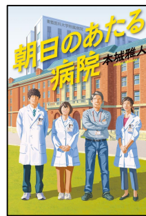
朝日のあたる病院 本城 雅人 著 光文社