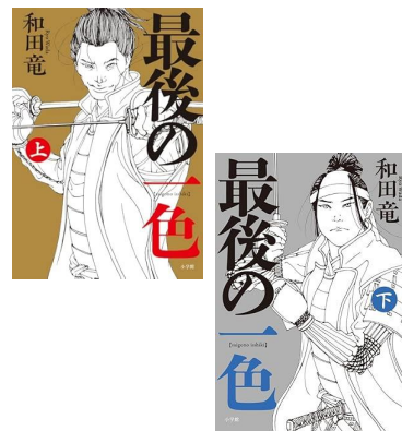
最後の色 上 下 和田 竜 著 小学館