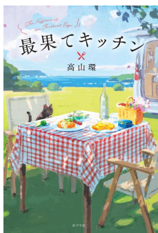
最果てキッチン 高山 環 著 ポプラ社