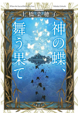
神の蝶、舞う果て 上橋 菜穂子 著 講談社

少年・ジェードは、神と魔物、光と闇が共に宿っているとされる、＜闇の大井戸＞で、魔物から聖なる蝶を守る役目を負って暮らしていた。ある日、ジェードの相棒である少女・ルクランが、鬼火に触れる事件が起きる。鬼火に激しく反応してしまうルクランは、聖域を守る者のなかで波紋を呼んでいた。自分がなぜ、そんな反応をするのかを知りたいと願うルクランと、ルクランを守りたいと思うジェード。