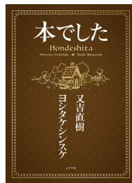
本でした 又吉直樹・ヨシタケシンスケ 著 ポプラ社