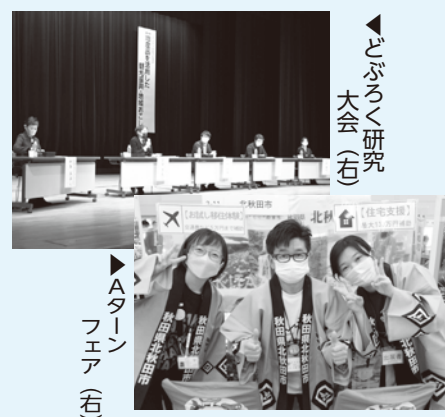
どぶろく研究大会(右)

そんな中「第16回全国どぶろく研究大会」が今年は北秋田市で行われ、「地産品を活用した観光振興・地域おこし」の討論形式の催しに私も登壇しました。「北秋田市の食文化の魅力を知り、薬膳料理や青果物の知識を伝えていきたい」という私の目標が研究大会のテーマに近いと思う「そこにしかないもの」という観光資源の可能性などを伝えたいと思いました。