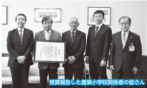
受賞報告した鷹巣小学校関係者の皆さん