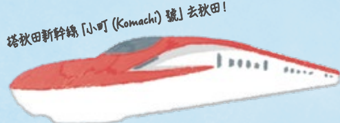
搭乘秋田新幹線「小町 (Komachi) 號」去秋田!