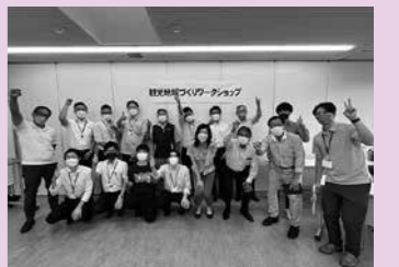
▲1回目のグループワークの様子