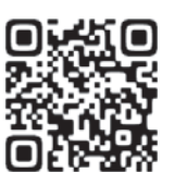
▲秋田県防災ポータルサイト

「国民保護」とは 武力攻撃や大規模テロ等から住民の皆さんの生命・身体・財産を保護するための仕組みです