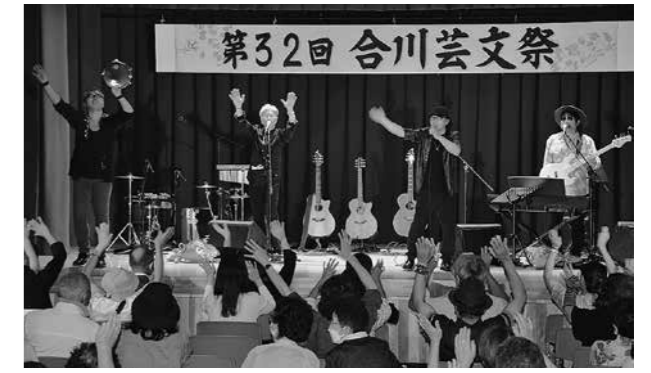
▲特別出演のポップスデュオ「ダックスムーン」フラワー、パステルアートなど多くの作品が展示され、会場を彩りました。

日ごろの活動の成果を披露 ～第32回合川芸文祭～ 第32回合川芸文祭が7月17日に合川公民館で開催され、合川地区で活動している団体などが日ごろの活動の成果を披露しました。 新型コロナウイルス感染症の影響により、3年ぶりの開催となった今回は、演示部門と展示部門が行われ、演示部門には、民謡、舞踊、コーラス、大正琴、太鼓などが出演したほか、特別出演として、今年で結成40周年のポップスデュオ「ダックスムーン」が出演し、3年ぶりの開催に花を添えました。 展示部門では、俳句、生け花、つまみ細工、ペーパー