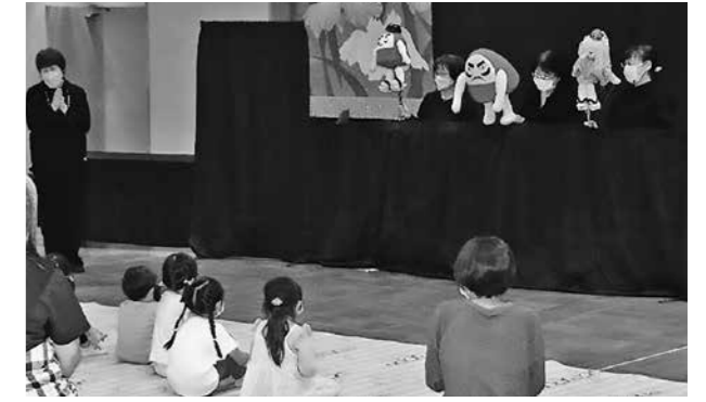
▲真剣に人形劇を鑑賞する阿仁合保育園の児童たち

劇団「おむすび座」による人形劇鑑賞会 ～阿仁公民館「地域児童健全育成事業」～ 阿仁公民館の人形劇鑑賞会が6月8日に行われ、阿仁合保育園の園児と阿仁かざはり苑の利用者ら26人が、秋田市の劇団「おむすび座」の皆さんによる人形劇やエプロンシアターなどを鑑賞しました。 人形劇「だるまちゃんとてんぐちゃん」では、だるまちゃんのセリフを真似したり、エプロンシアター「オオカミと七ひきの子ヤギ」では、オオカミの鳴き声に驚いたり、会場からは終始園児の元気な声が飛び交っていました。