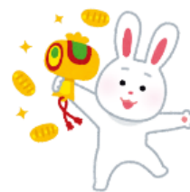
図書館カレンダー（鷹・森） 休館日