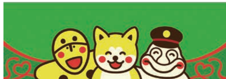
秋田犬といせどうくんと笑う岩偶