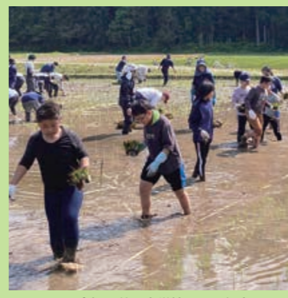
平里会場 前田小学校3~6年生