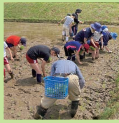
小淵会場 阿仁合小学校3~6年生