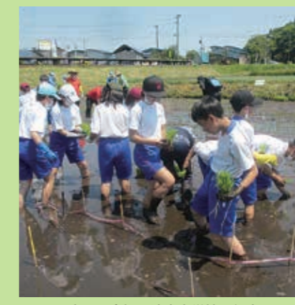
小ヶ田会場 清鷹小学校5年生