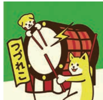
秋田犬と綴子大太鼓