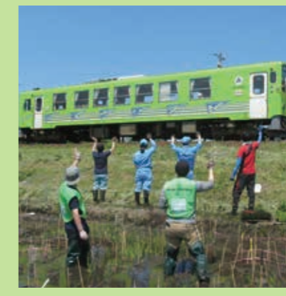
小ヶ田会場 内陸線に手を振っておもてなし♡

秋田内陸線田んぼアートの田植えの様子を紹介! 今年で11年目となった内陸線の風物詩「田んぼアート」の田植え作業が5月24日は平里・小淵、25日は縄文小ヶ田駅向かいの会場で行われました。「田植えは初めて」という地元の小学生在が3年ぶりに参加し、地域の方から植え方を教わりながら、泥まみれになり作業をしました。小ヶ田地区では秋田県内に支店を置く企業の皆さまにもご参加いただき、今後の出来映えを情報発信していく予定です。 今年のデザインは「秋田犬とのコラボ」がテーマで、沿線5か所で実施しており、6月下旬には見頃を迎えます。