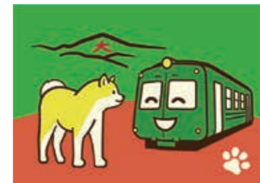
秋田犬と青ガエル