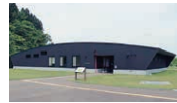
▲遺跡の近くにある黒い建物だよ