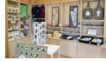
▲オリジナルグッズもあるよ