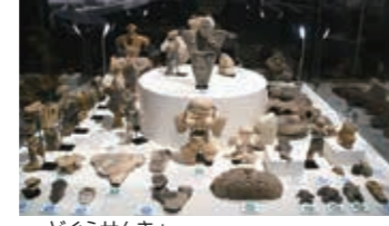
▲土偶選挙をやってるよ