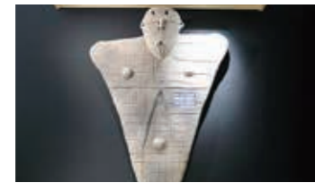
▲エントランスにはボクがいるよ