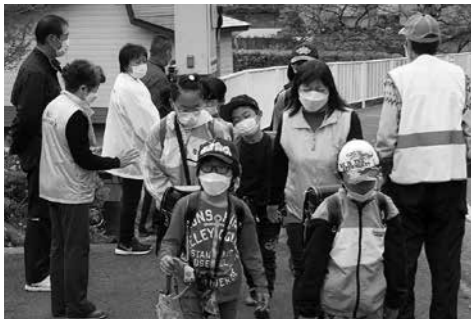
▲児童の見守り活動「あいさつ運動」 (阿仁地区)

相談内容により必要な支援を受けられるよう関係機関へつなぐ「パイプ役」となります。